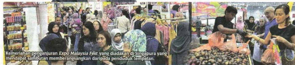
Kemeriahan penganjuran Expo Malaysia Fest yang diadakan di Singapura yang mendapat sambutan memberangsangkan daripada penduduk tempatan.