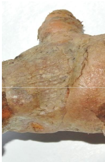
Cacat Rupa (Kering)