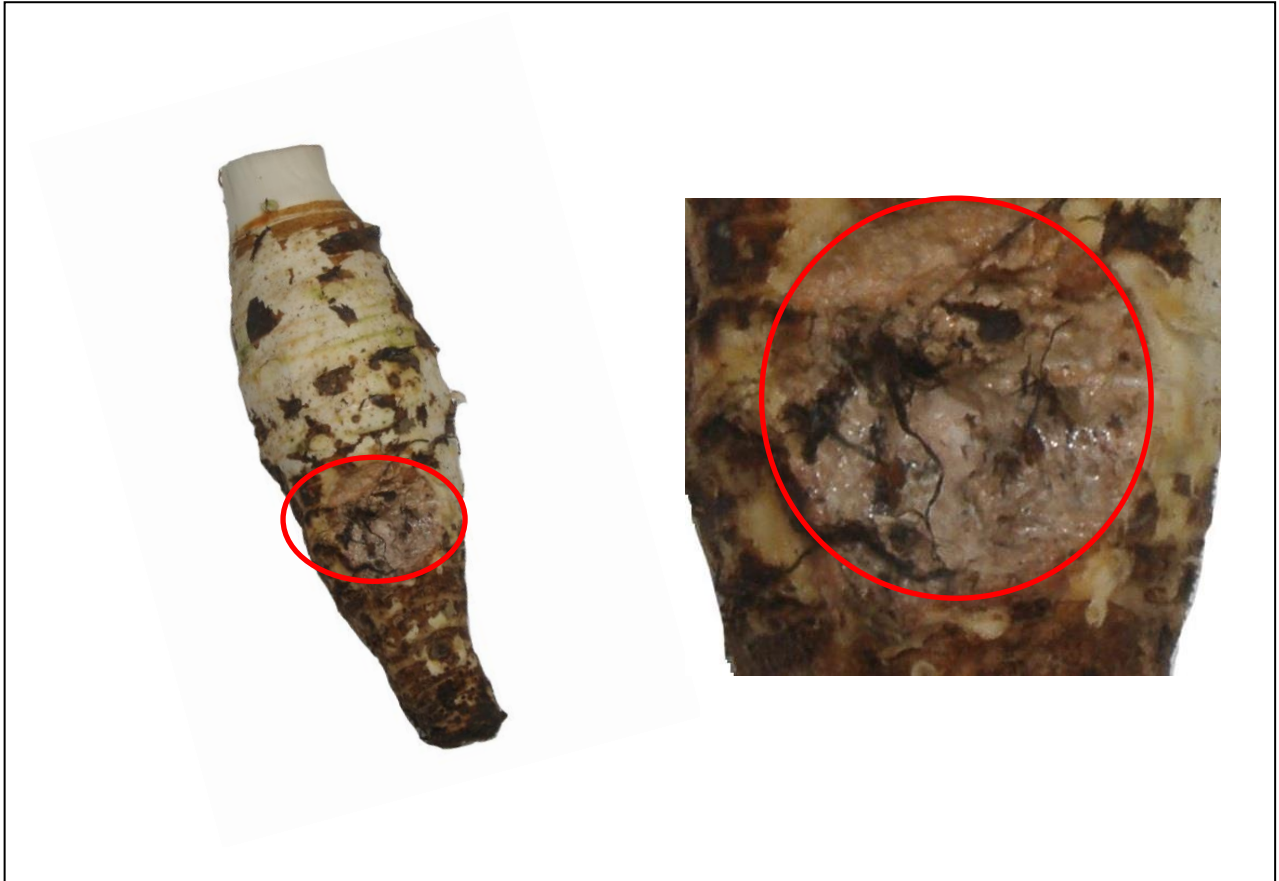
Busuk dan berair