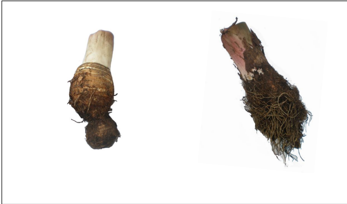
Bentuk tidak seimbang