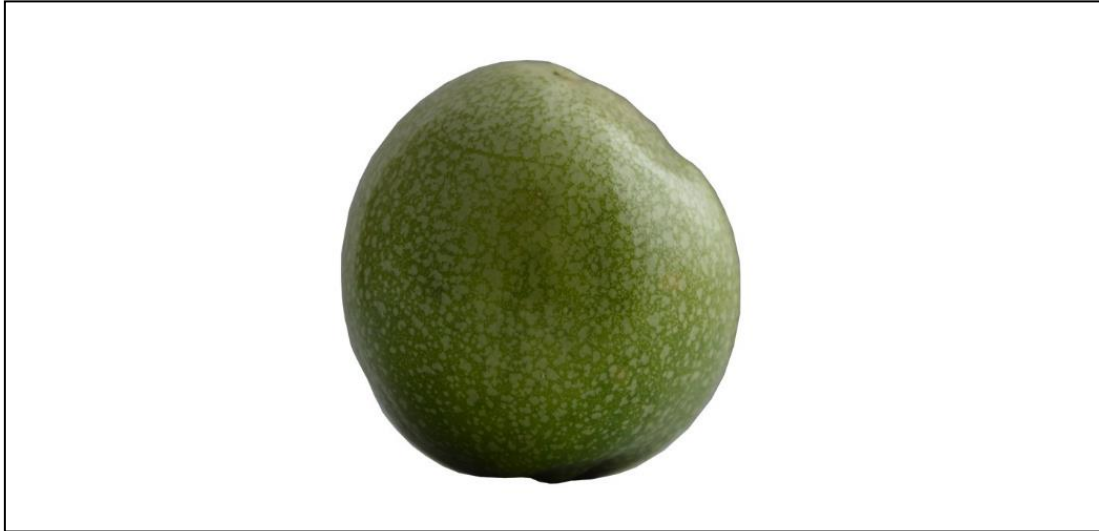
Bentuk tidak sempurna