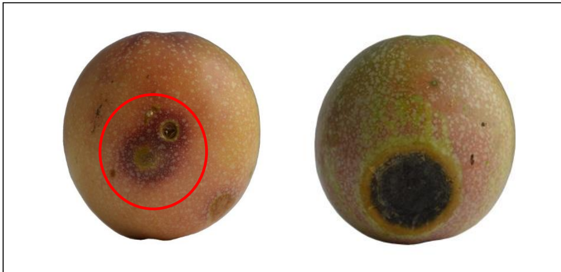
Serangan lalat buah

Kecederaan disebabkan oleh perosak dan penyakit