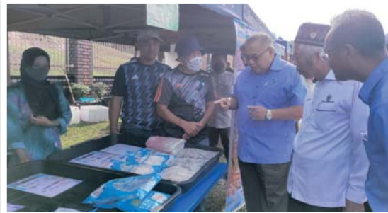
Produk hasil laut turut dijual kepada pengguna sepanjang Program Khas JTDLKM.