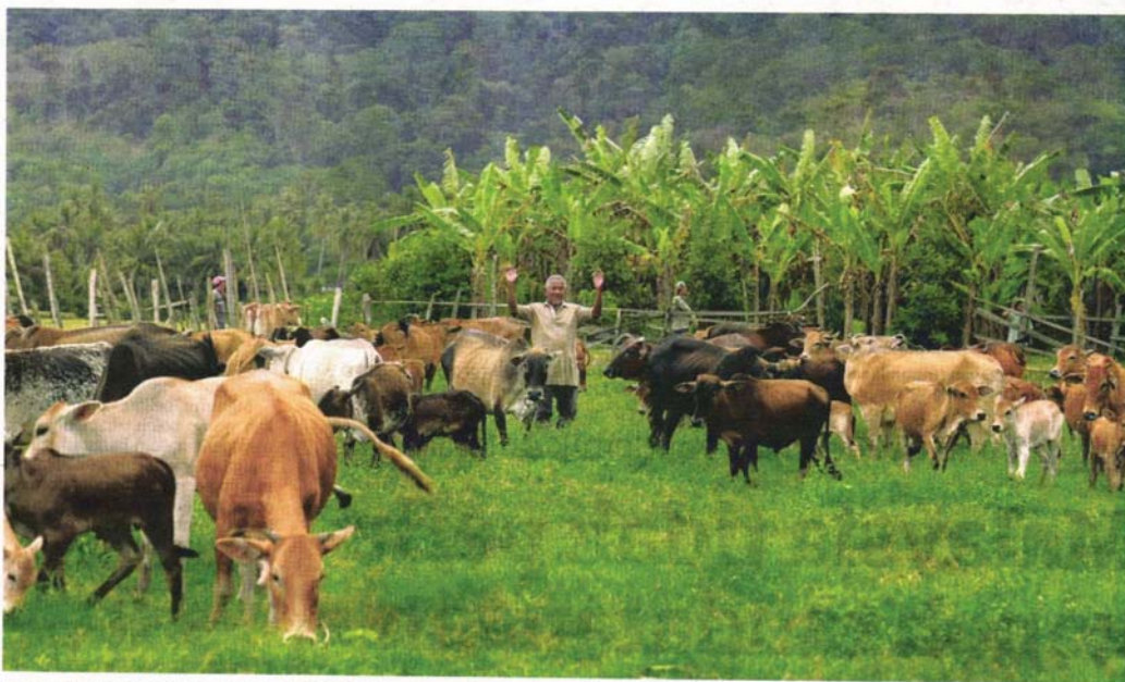
INDUSTRI ruminan negara memerlukan penstrukturan semula secara menyeluruh bukan sahaja bagi mengurangkan kebergantungan kepada daging import tetapi juga mampu membela nasib dan meningkatkan pendapatan golongan penternak di seluruh negara.

Paling utama, mereka meminta kerajaan segera mengawal harga