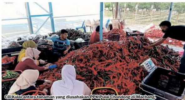
Cili Kulai (antara tanaman yang diusahakan PPK Pulau Chondong di Machang).