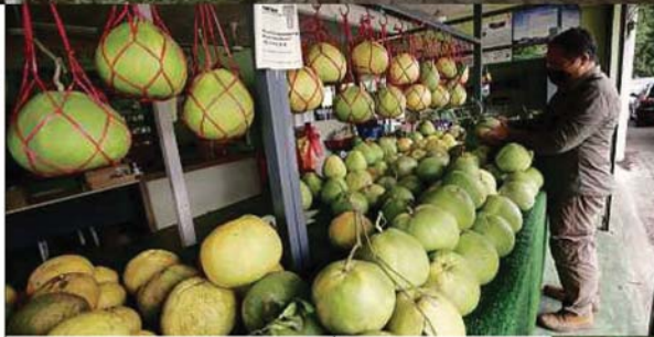
Swee Kong, di gerai limau bali keluaran ladangnya di hadapan Gochin Tambun Pomelo Agro Farm, Tambun di Ipoh.

"Tidak dinafikan jenis buah manis lebih mendapat permintaan tetapi sejak kebelakangan ini jenis masam manis