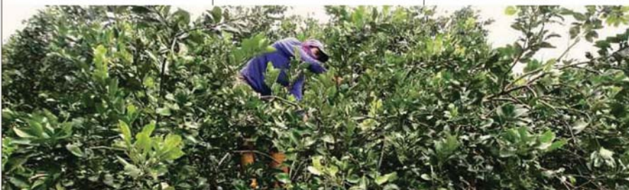
Pekerja Gochin Tambun Pomelo Agro Farm, Tambun di Ipoh melakukan pemangkasan pada pokok limau bali.