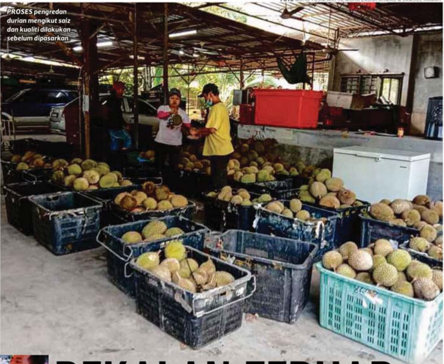
PROSES pengredan durian mengikut saiz dan kualiti dilakukan sebelum dipasarkan.

Contohnya dua minggu lalu, harga melonjak bagi semua jenis durian kerana kebiasaan pada awal musim, buah yang luruh tidak serentak di semua tempat SAMSUL