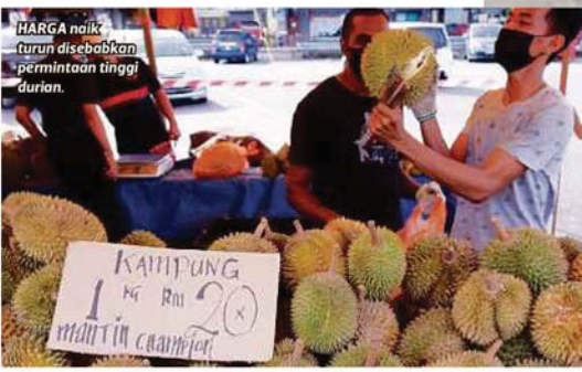
HARGA naik turun disebabkan permintaan tinggi durian.