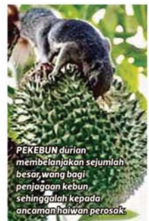
PEKEBUN durian membelanjakan sejumlah besar wang bagi penjagaan kebun sehinggalah kepada ancaman haiwan perosak.

Harga durian bermutu tinggi di pasaran wajar apabila diambil kira kos dilabur setiap pekebun