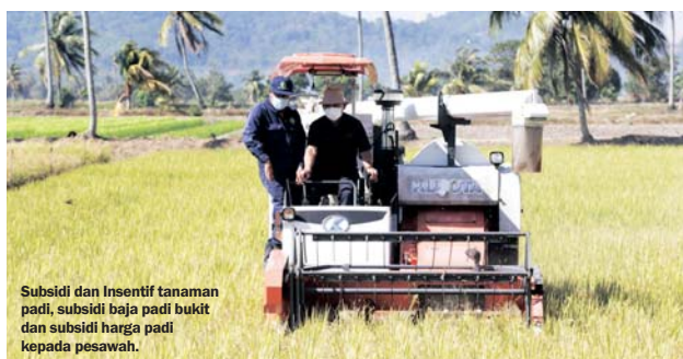
Subsidi dan Insentif tanaman padi, subsidi baja padi bukit dan subsidi harga padi kepada pesawah.

Untuk jangka masa panjang, melalui FSCC Malaysia sudah pasti akan dapat meningkatkan