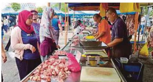
JUALAN daging tempatan segar antara yang menarik minat pengunjung.