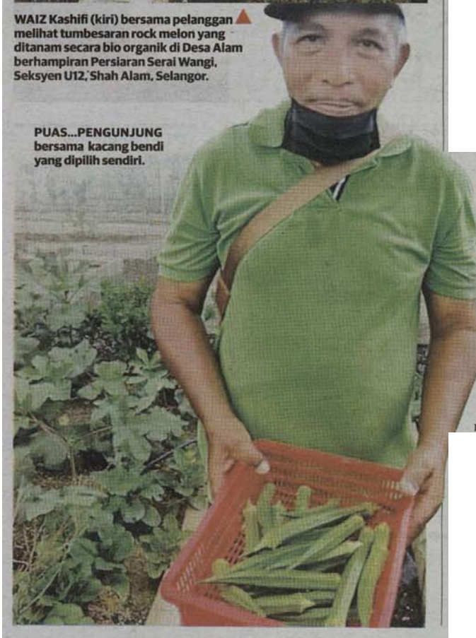
PUAS...PENGUNJUNG bersama kacang bendi yang dipilih sendiri.