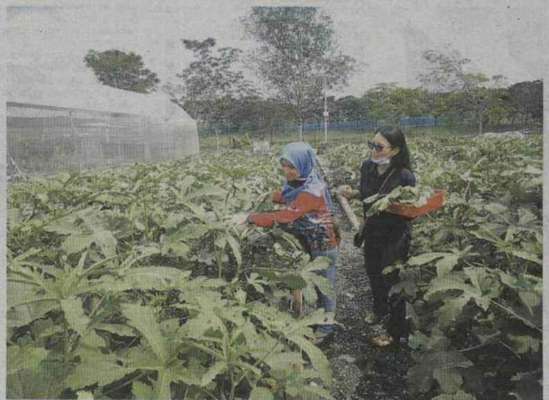
MEMETIK sendiri sayur seperti bendi memberi pengalaman yang mengujakan kepada pelanggan yang biasanya tinggal di kawasan perumahan 'hutan batu'.

"Namun timbul idea untuk golongan ini kita bantu dengan memberi mereka peluang pekerjaan menanam sayur dan mengusahakan bisnes