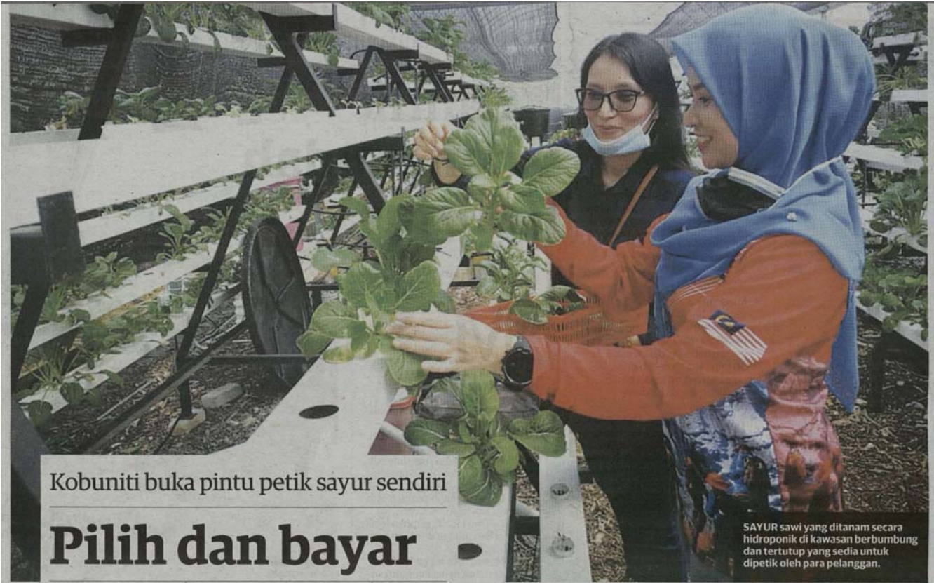
Kobuniti buka pintu petik sayur sendiri