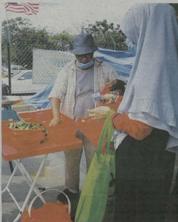
SAYUR-SAYURAN yang dipilih ditimbang dan dijual dengan harga berpatutan.

mereka sendiri kelak sebagai usahawan," katanya kepada Utusan Malaysia .