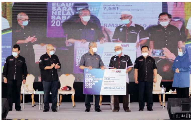
Muhyiddin (tiga dari kiri) menyerahkan bayaran Elaun Sara Hidup Nelayan Sabah 2020 pada program Perdana Menteri Bersama Peladang, Penternak dan Nelayan Sabah serta Pelancaran Skim Subsidi Baja dan Racun Padi Bukit/Huma di Beaufort semalam.

"Keluasan tanah pertanian Sabah adalah jauh lebih luas walaupun jika dibandingkan dengan keluasan seluruh negeri tertentu di Semenanjung Malaysia.