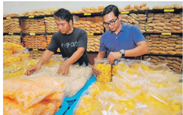
Gabungan Malaysia berpendapat usahawan mikro memerlukan bantuan kewangan untuk meneruskan perniagaan berbanding beralih ke bisnes baharu.