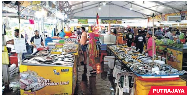
Beginilah keadaan PST di Putrajaya.