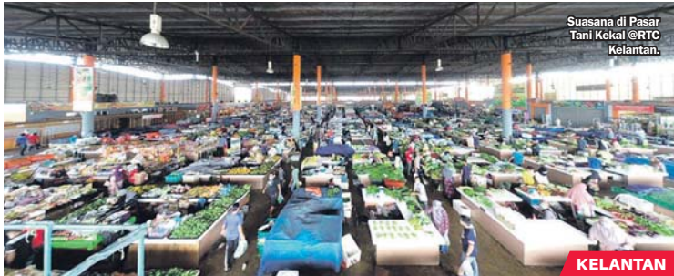
Suasana di Pasar Tani Kekal @RTC Kelantan.

Seorang pelanggan membasuh tangan selepas berbelanja di MyFarm Outlet (MFO) Chendering, Terengganu.