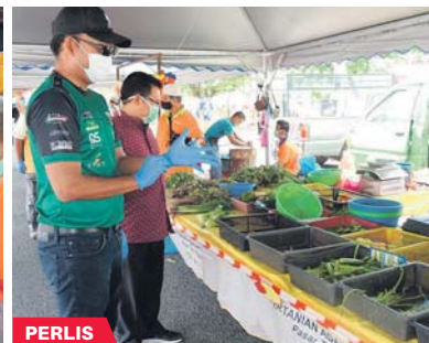
Pelbagai jenis sayuran dijual di PST Taman Sena Indah, Kangar, Perlis.