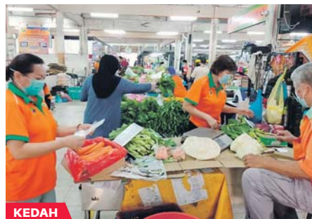
Orang ramai mendapatkan barangan keperluan di PST Guar Chempedak, Kedah.