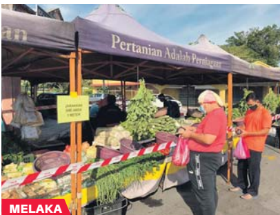
Orang ramai perlu menjarakkan diri satu meter di PST Masjid Tanah Melaka.