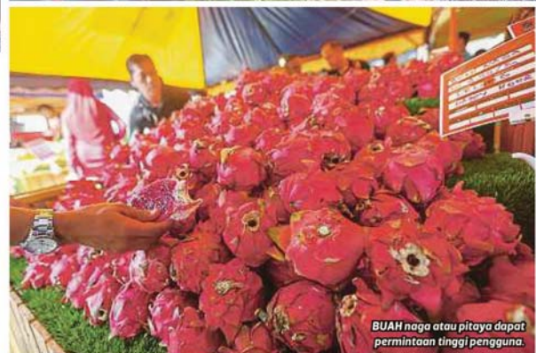
BUAH naga atau pitaya dapat permintaan tinggi pengguna.

melalui perancangan pengeluaran dan pemasaran bersestematik serta mempercepatkan pemindahan teknologi dalam rantaian bekalan.