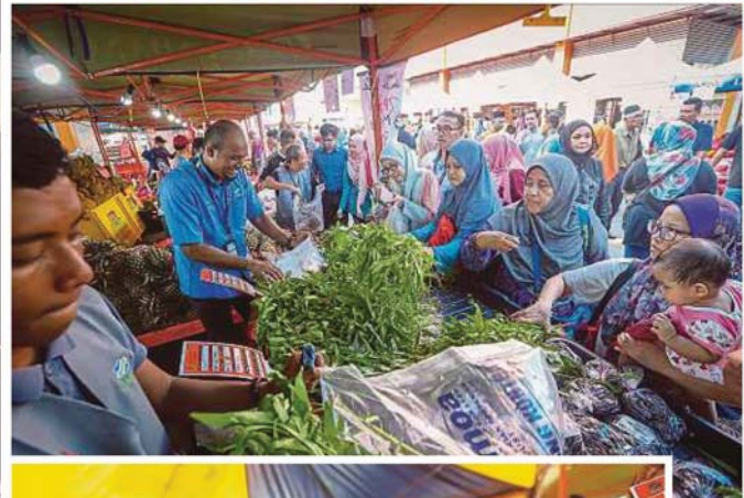
PESERTA JTDL berpeluang berdepan sendiri dengan pengguna.