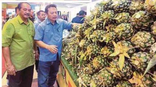
NANAS antara buah-buahan yang tersenarai dalam ladang kontrak.