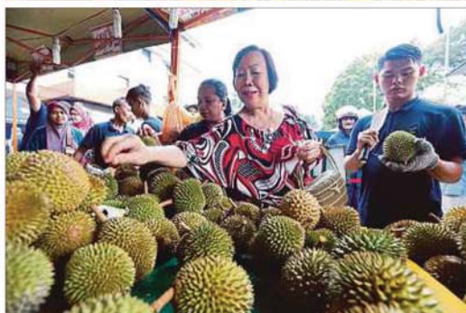
DURIAN pada harga lebih murah daripada pasaran di JTDL.