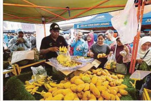
ORANG ramai memilih sendiri buah mangga segar.