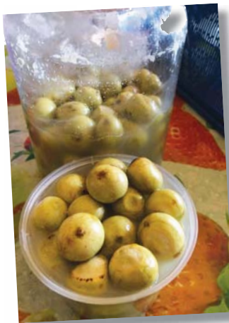
BUAH Engkalak muda yang telah dijadikan jeruk.