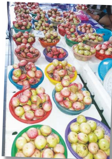
BUAH Engkalak yang dijual di pasar.

"Bagi yang belum pernah makan, bolehlah mencuba untuk merasai sendiri keenakan buah Engkalak sementara adanya musim buah ini," ujarnya.