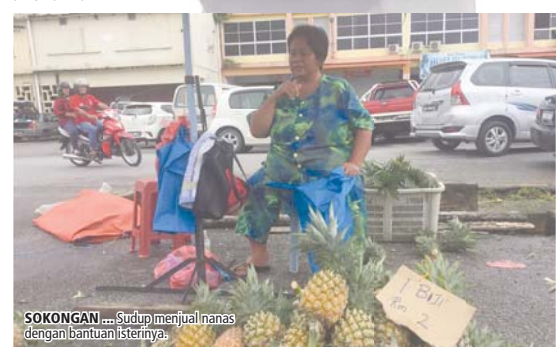
SOKONGAN... Sudup menjual nenas dengan bantuan isterinya.