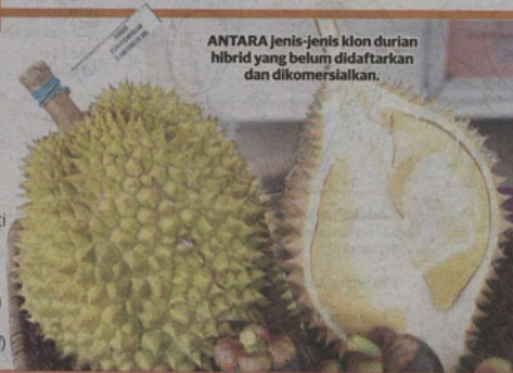
ANTARA jenis-jenis klon durian hibrid yang belum didaftarkan dan dikomersialkan.