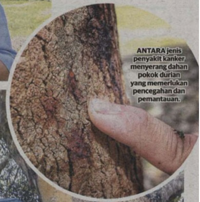
ANTARA jenis penyakit kanker, menyerang dahan pokok durian yang memerlukan pencegahan dan pemantauan.

"Melalui pengurusan yang betul, siri MDUR akan berbuah secara tetap pada setiap tahun dalam tempoh musim durian," ujarnya.