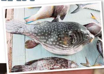
HIDANGAN ikan Buntal masak Sinagol dimakan bersama nasi.

Halaman rumah ketua kampung yang luas menjadi tapak pengumpulan buah kelapa selain penduduk mengadakan perjumpaan dan mesyuarat bersama ketua kampung. Seorang penduduk, Jun