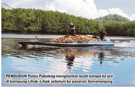
PENDUDUK Pulau Pababag menghantar buah kelapa ke jeti di kampung Lihak-Lihak sebelum ke pasaran Semenanjung.

Mereka membawa hidangan beserta sepinggan beras yang diselitkan dengan wang seringgit sebagai upah kepada imam. Menurut imam kampung, penduduk mengadakan doa selamat sebagai tanda kesyukuran dan terima kasih dengan kehadiran pelawat serta usaha berterusan agensi FAMA membantu ekonomi penduduk dengan membawa kelapa dari pulau ini untuk pasaran di Semenanjung. Pengalaman mendekati masyarakat Bajau Darat dan Sulu di Sabah ini sangat dihargai!