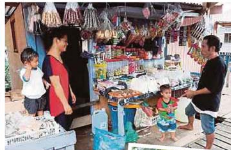
PENDUDUK Bajau di perkampungan air Tanjong Kapor bemiaga runcit barangan keperluan.