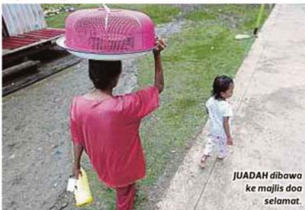
JUADAH dibawa ke majlis doa selamat.