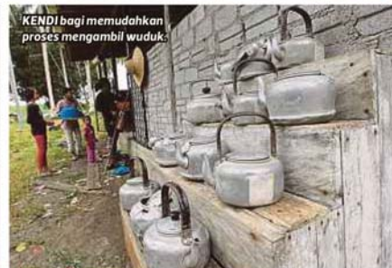
KENDI bagi memudahkan proses mengambil wuduk.