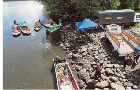
JETI di kampung Lihak-Lihak.