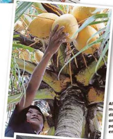
AIR kelapa mawar dikatakan antara paling enak.