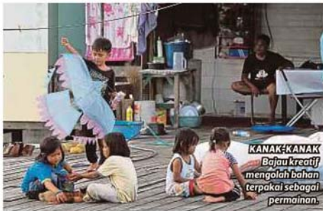
KANAK-KANAK Bajau kreatif mengolah bahan terpakai sebagai permainan.