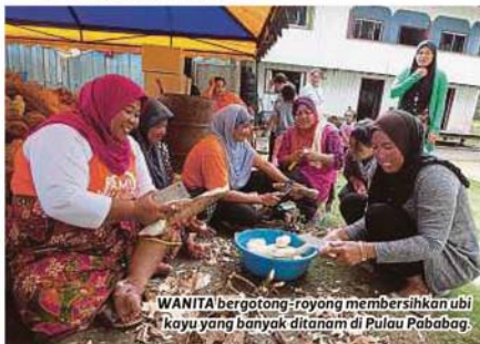
WANITA bergotong-royong membersihkan ubi kayu yang banyak ditanam di Pulau Pababag.