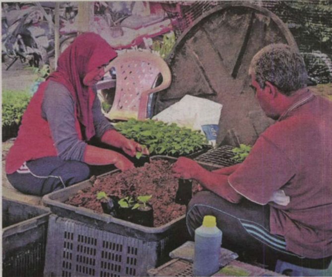
ISTERI turut membantu.