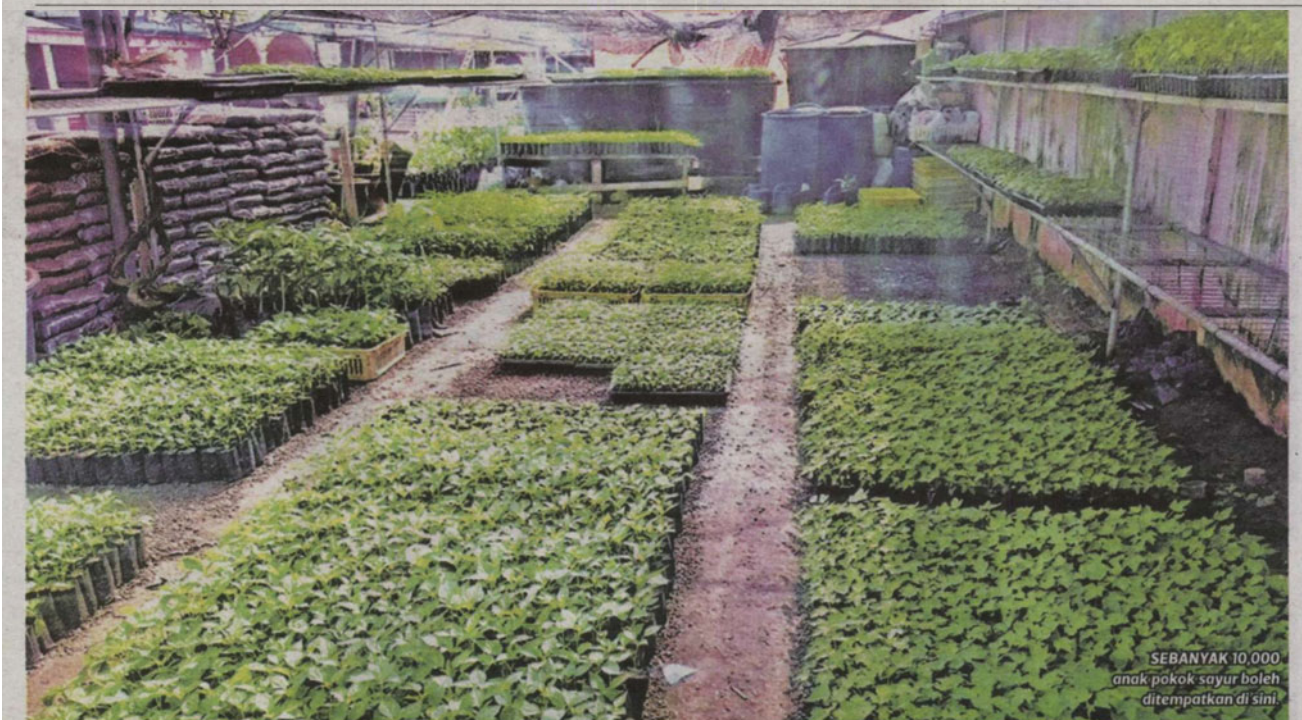
SEBANYAK 10,000 anak pokok sayur boleh ditempatkan di sini.