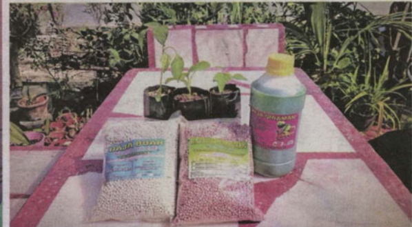
BAJA untuk pembesaran pokok dan buah juga turut dijual.

inci lebar yang sudah diisi ampunan tanah serta arang sekam padi.